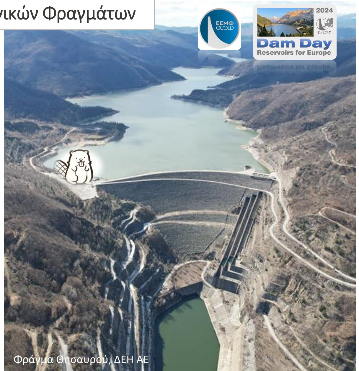
Φράγμα Θησαυρού, ΔΕΗ ΑΕ