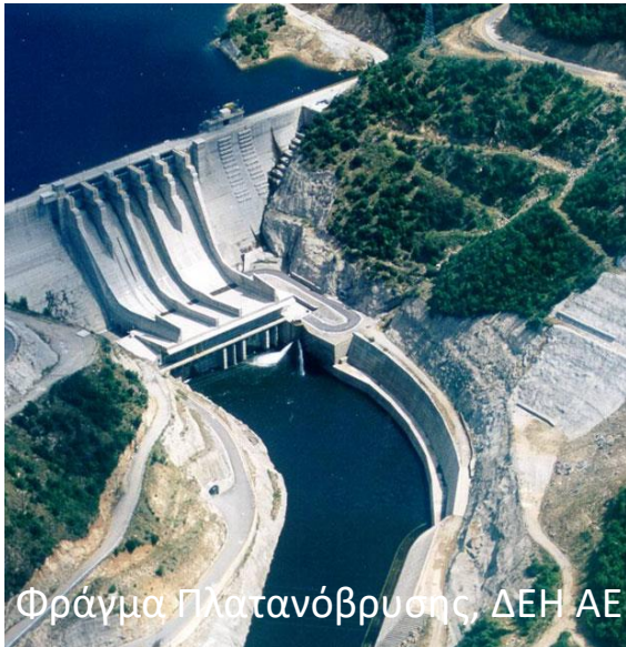
Φράγμα Πλατανόβρυσης, ΔΕΗ ΑΕ