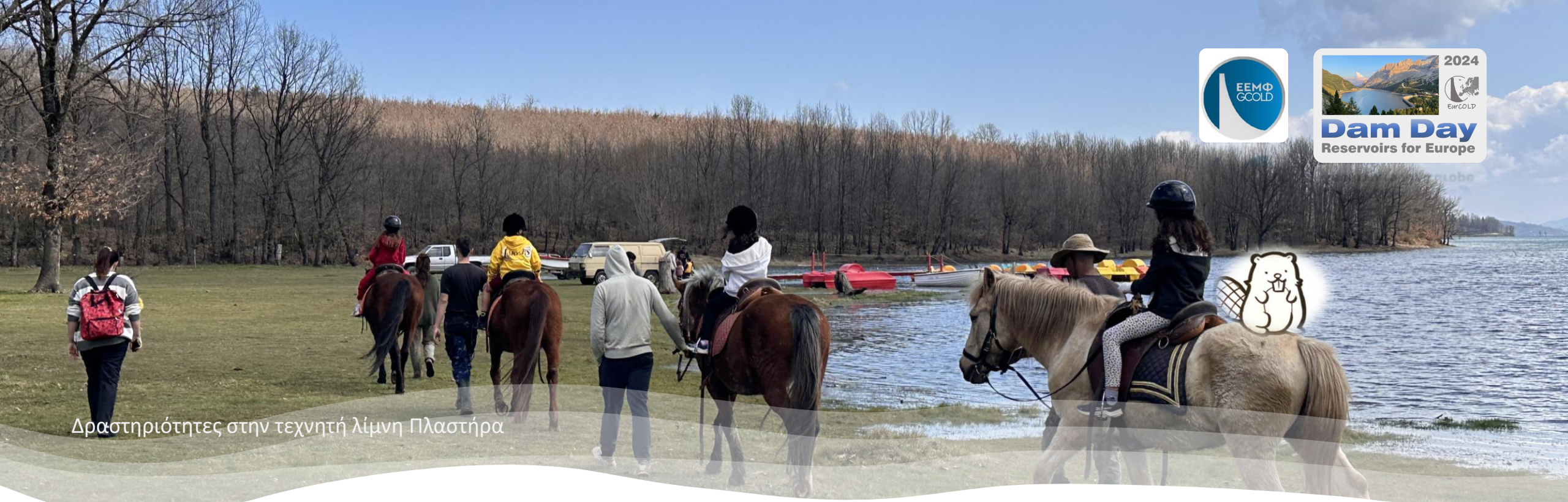
Δραστηριότητες στην τεχνητή λίμνη Πλαστήρα