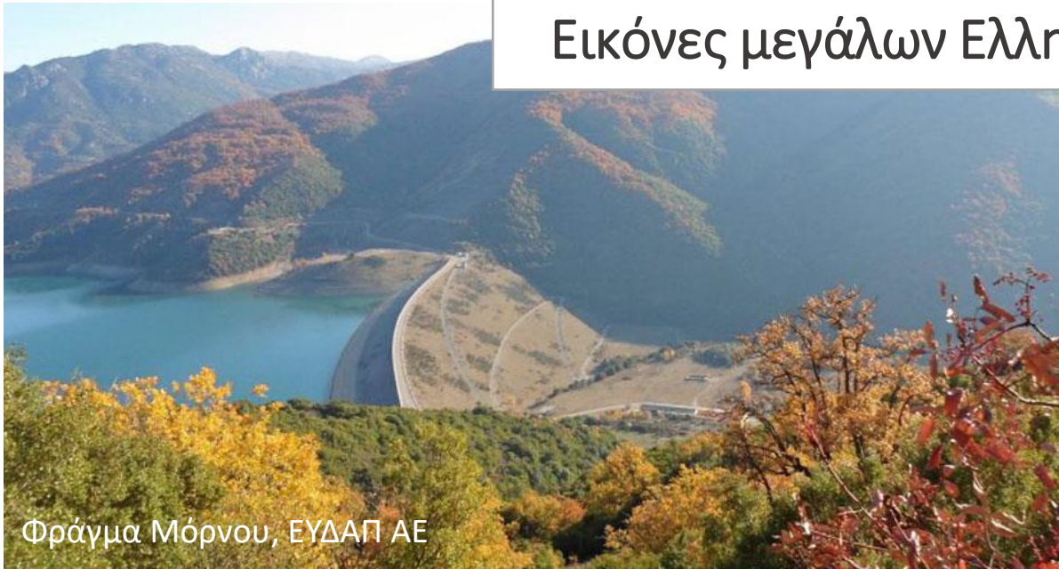
Φράγμα Μόρνου, ΕΥΔΑΠ ΑΕ