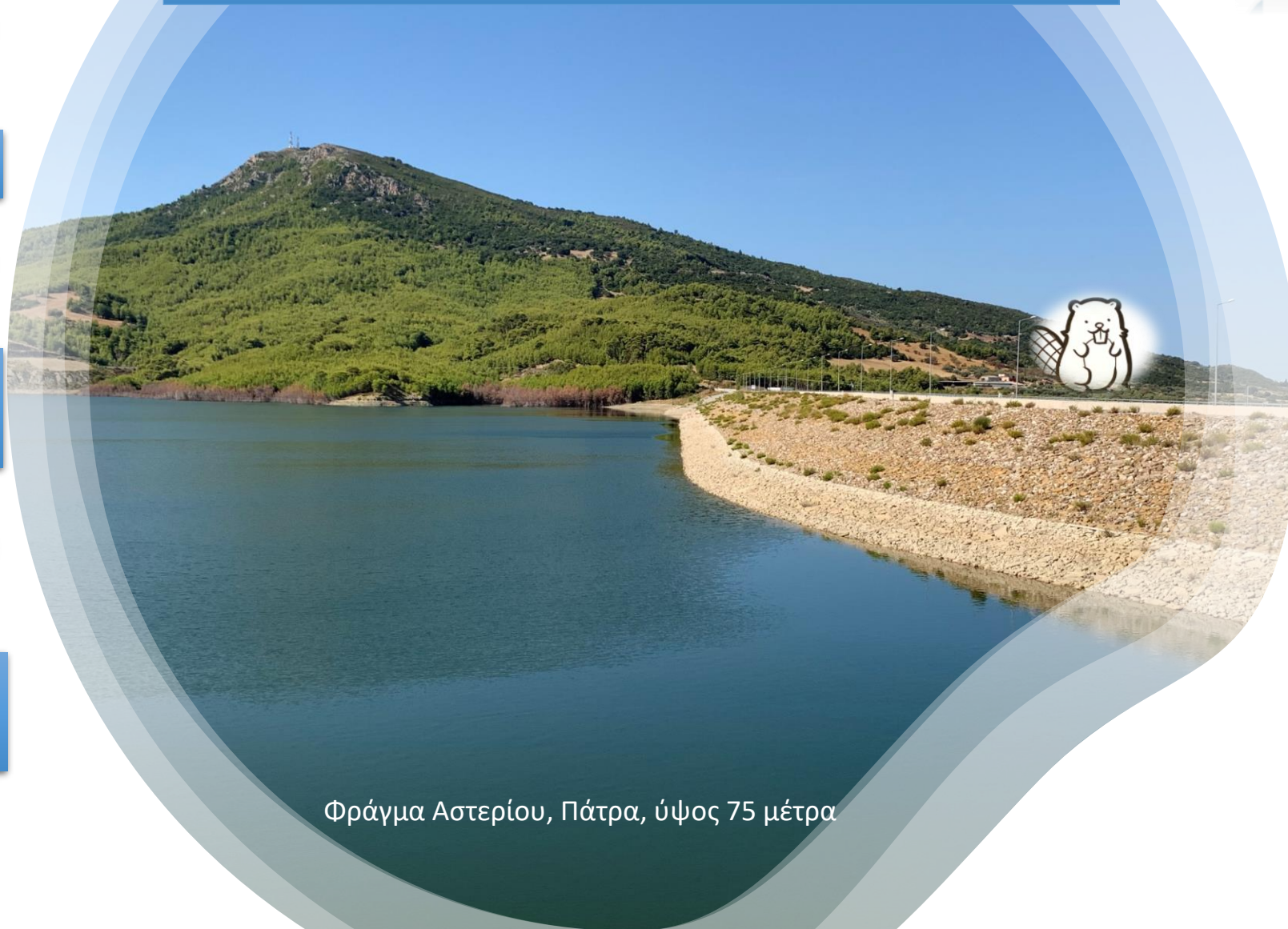
Φράγμα Αστερίου, Πάτρα, ύψος 75 μέτρα