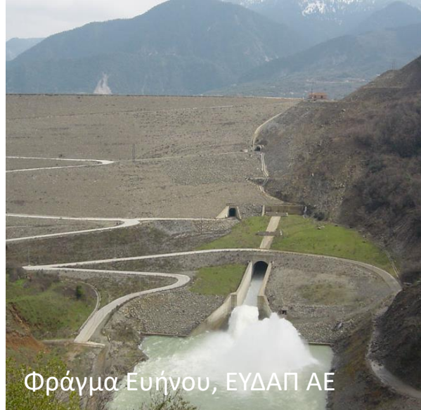
Φράγμα Ευήνου, ΕΥΔΑΠ ΑΕ